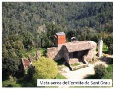
Vista aerea de l'ermita de Sant Grau