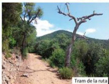
Tram de la ruta